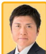
中野 洋昌氏 衆議院議員