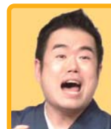
浪漫亭不良雲氏 ろまんていふうらうん 社会人落語