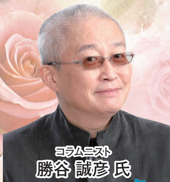
司会 勝谷 誠彦氏