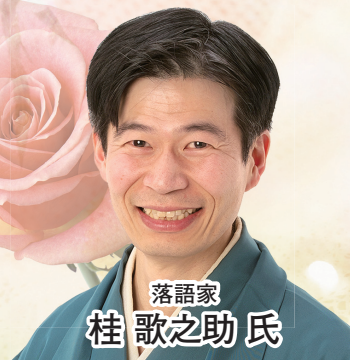
落語家 桂 歌之助氏